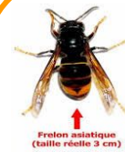
Frelon asiatique (taille réelle 3 cm)