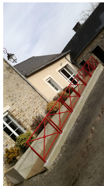
Installation de barrières de sécurité à la Mairie