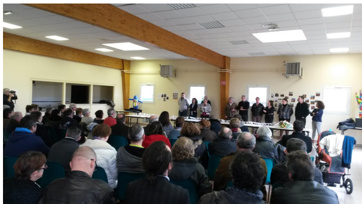
De nombreuses personnes étaient présentes aux vœux du Conseil Municipal 2017

Cela concerne les travaux d'entretien pour les divers bâtiments communaux, les demandes de devis divers fenêtres et portes de l'école et divers mobilier, remplacement des imprimantes mairie et école, cimetière (columbarium, cavurnes, jardin du souvenir entretien des portails), ralentisseurs entrée du bourg, peinture salle multifonction, aménagement côté salle d'un local spécial chaises et tables.