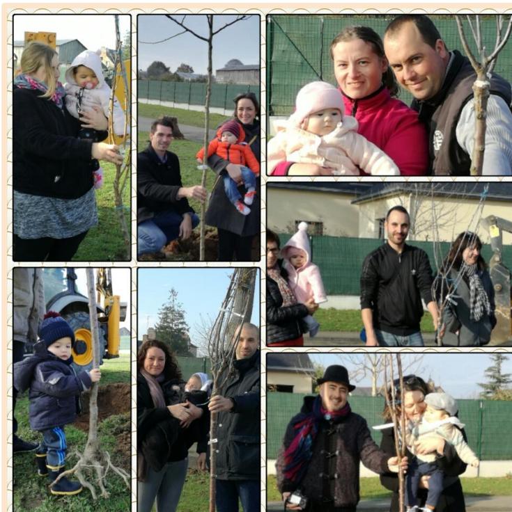
Moment d'émotion: les bébés de 2016 ont planté leurs arbres de naissance près du terrain de jeux.