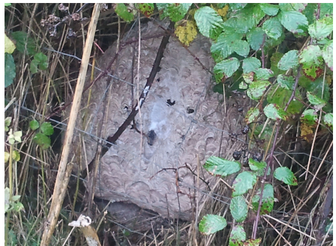
Nid de frelon asiatique à même le sol