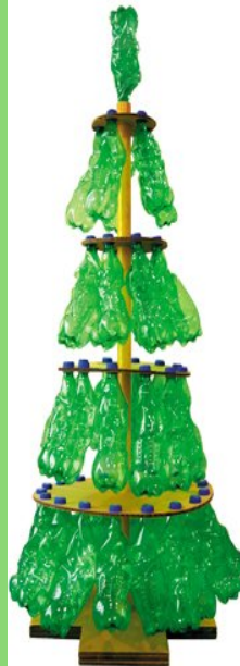
Sapin de Noël WWF

Venez nombreux seul ou en famille pour un moment créatif et de partage dans l'esprit de Noël. Pot de convivialité offert.