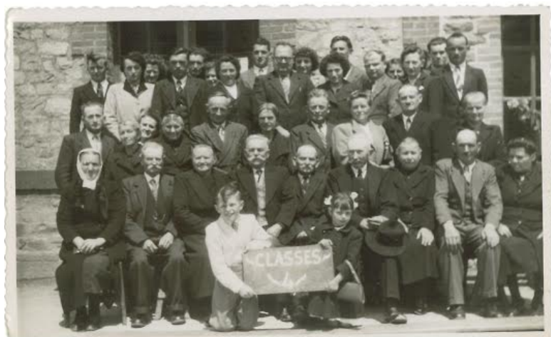
Classes 4 en 1954 -