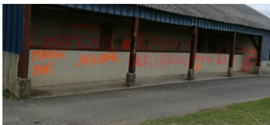
Local du foot et panneau de l'air de jeux dégradés

Pour vous, artistes en mal de reconnaissance, si vous souhaitez pratiquer l'art de rue, la municipalité peut proposer de vrais supports et vous conseiller sur un style plus épuré qui conviendra à tous! Artistes candides s'abstenir! Inscription en mairie.